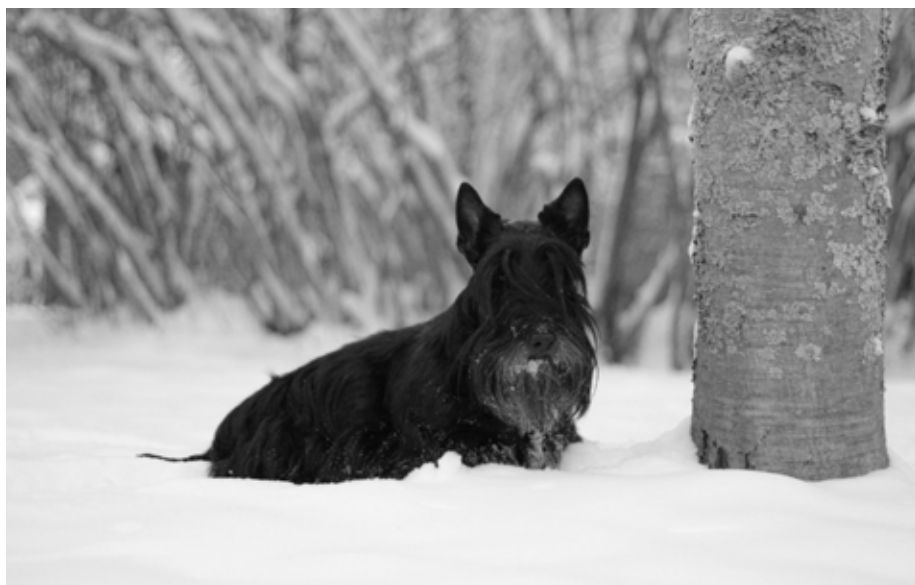
4. Palkinto: Inka Tossavainen