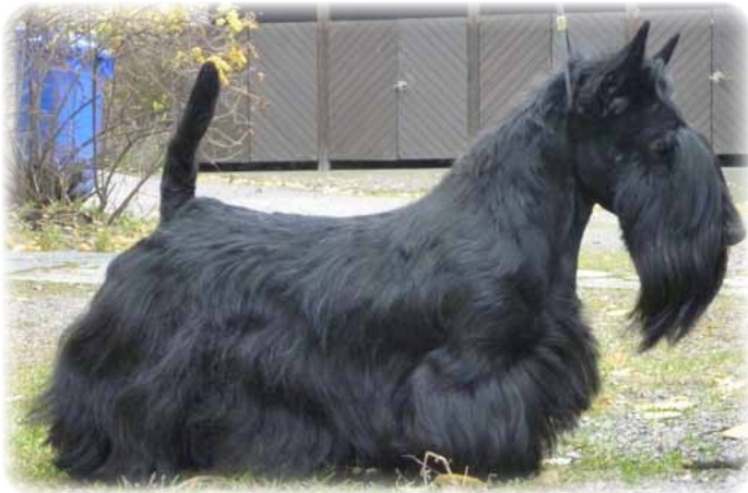
Bartos Ultra Rose