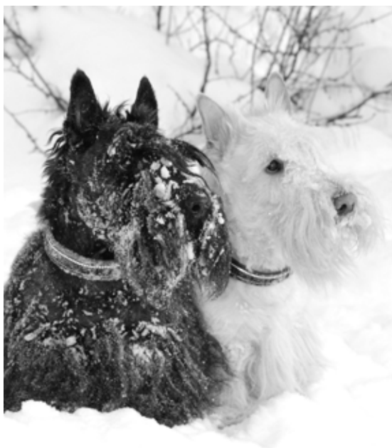
3. Palkinto: Heimo Hakulinen