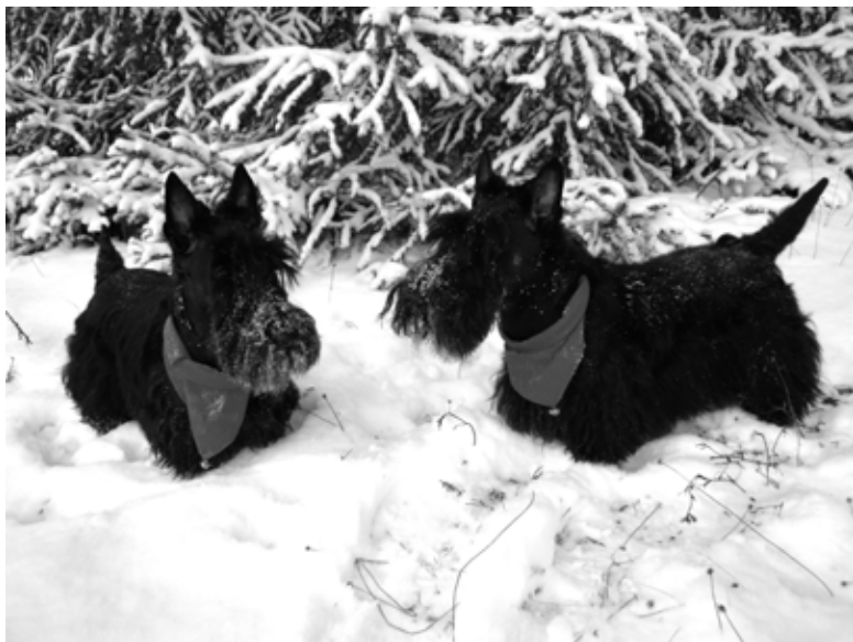
2. Palkinto: Tiina Jokela