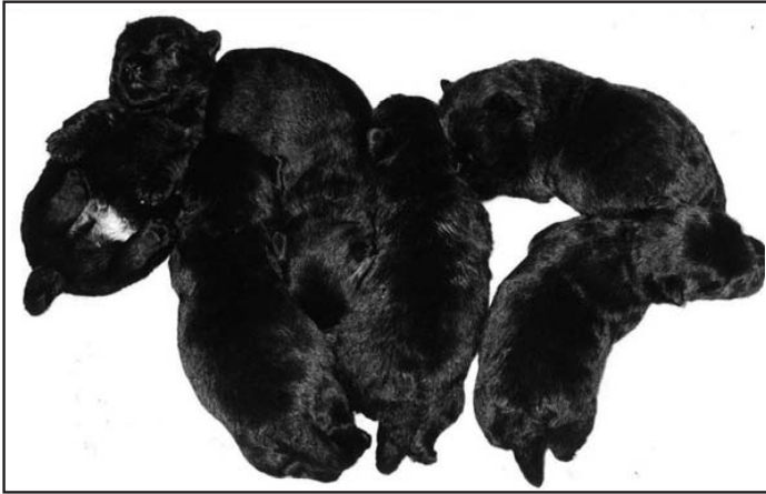
CH Maryglen Winsome Victorian pennut

J oulukuun 23. päivänä 1990 syntyi ensimmäinen Maryglen skottipentue.