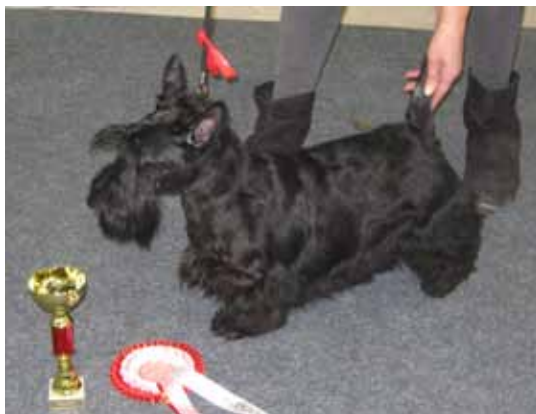
Peippa's Dorothea 1KP RYP 4-PENTU